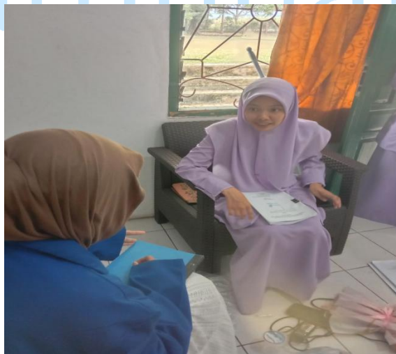
Wawancara Bersama Kepala Asrama