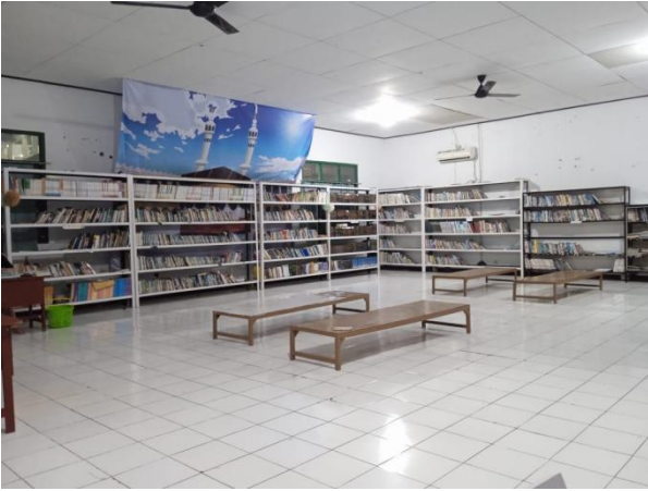
Kondisi Ruang Perpustakaan