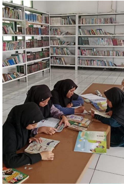
Kegiatan ekstrakurikuler D'Valist