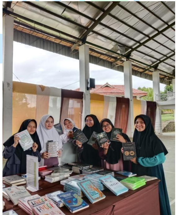
Pameran Buku di Darunnajah 2 Cipining