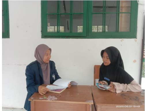
Wawancara Bersama Santriwati