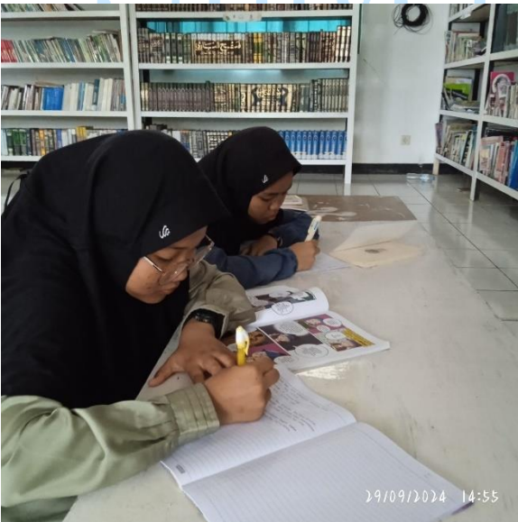
Kegiatan Ekstrakurikuler D'Valist