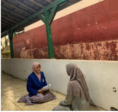
Wawancara dengan pembimbing divisi pengajaran