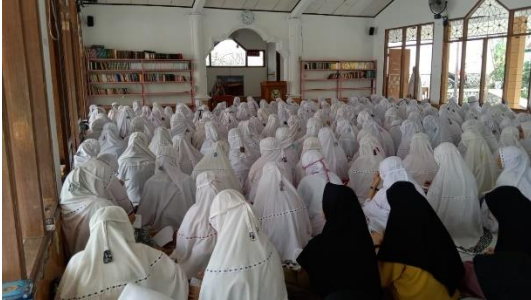
Taklim Pengajaran Ba'da Asar Berama Ustadzah Asrama