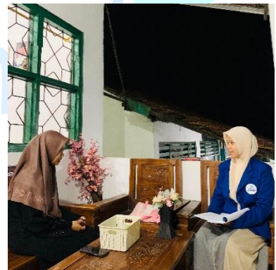
Wawancara dengan kepala asrama putri