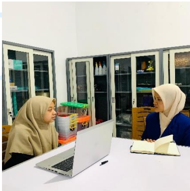
Wawancara dengan direktur pengasuhan santri