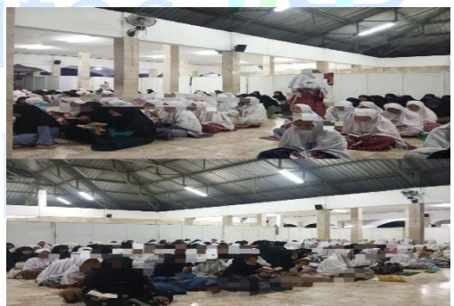
Taklim Rabu Pagi Bersama Kepala Asrama Putri