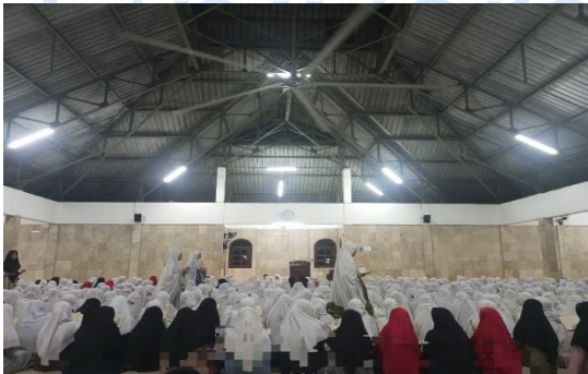
Taklim Senin Pagi Bersama Direktur Pengasuhan Putri