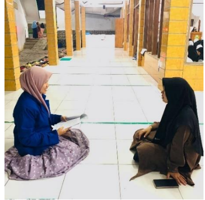
Wawancara dengan pembimbing divisi ibadah