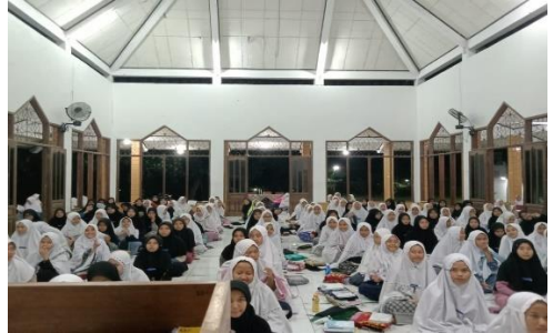
Taklim Pengajaran Ba'da Isya Bersama Kelas 5 TMI