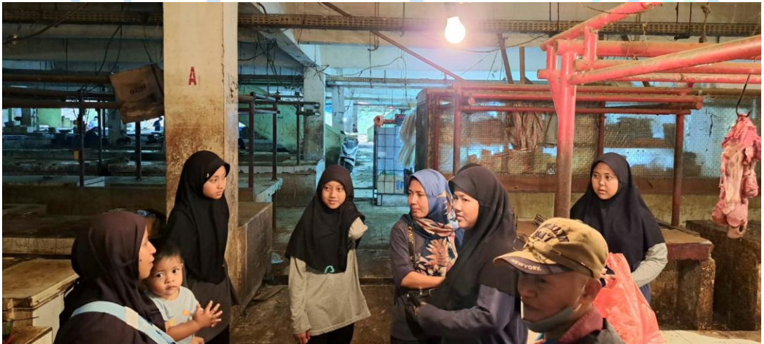
Gambar 1.7 Prakter Belanja Dan Masak-masak