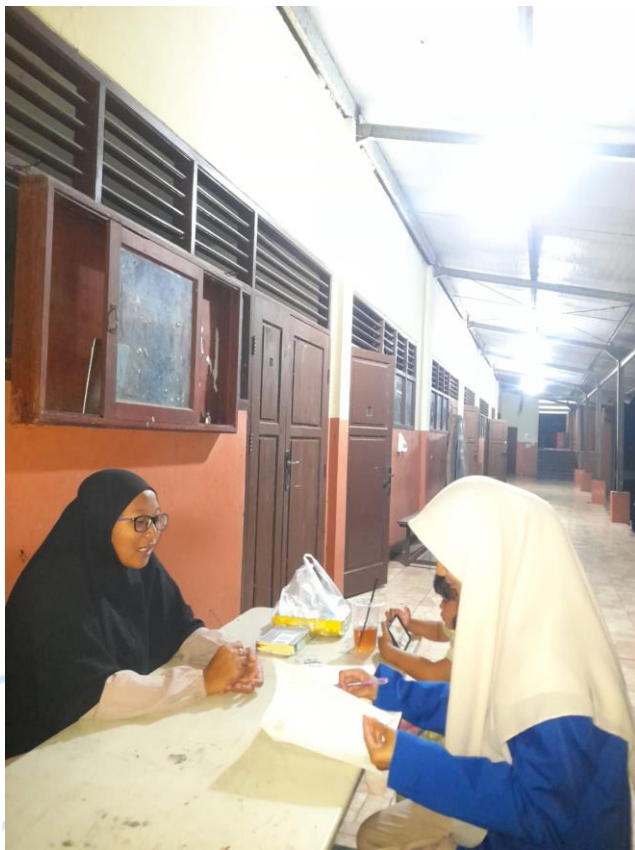
Gambar 1.2 Wawancara bersama pengasuhan santri putri