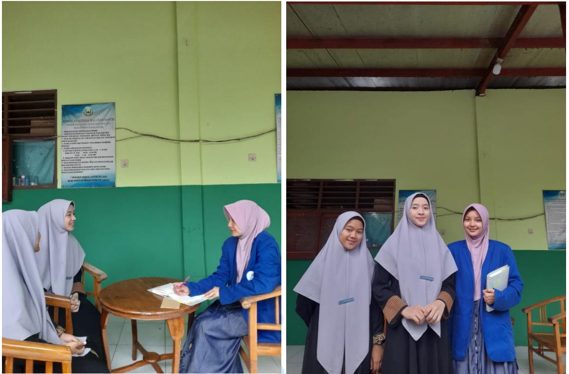
Gambar 1.5 wawancara bersama bagian nisaiyah OSANDN