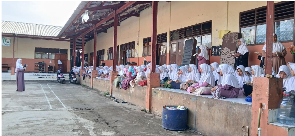
Gambar 1.8 Kegiatan Fiqhunnisa