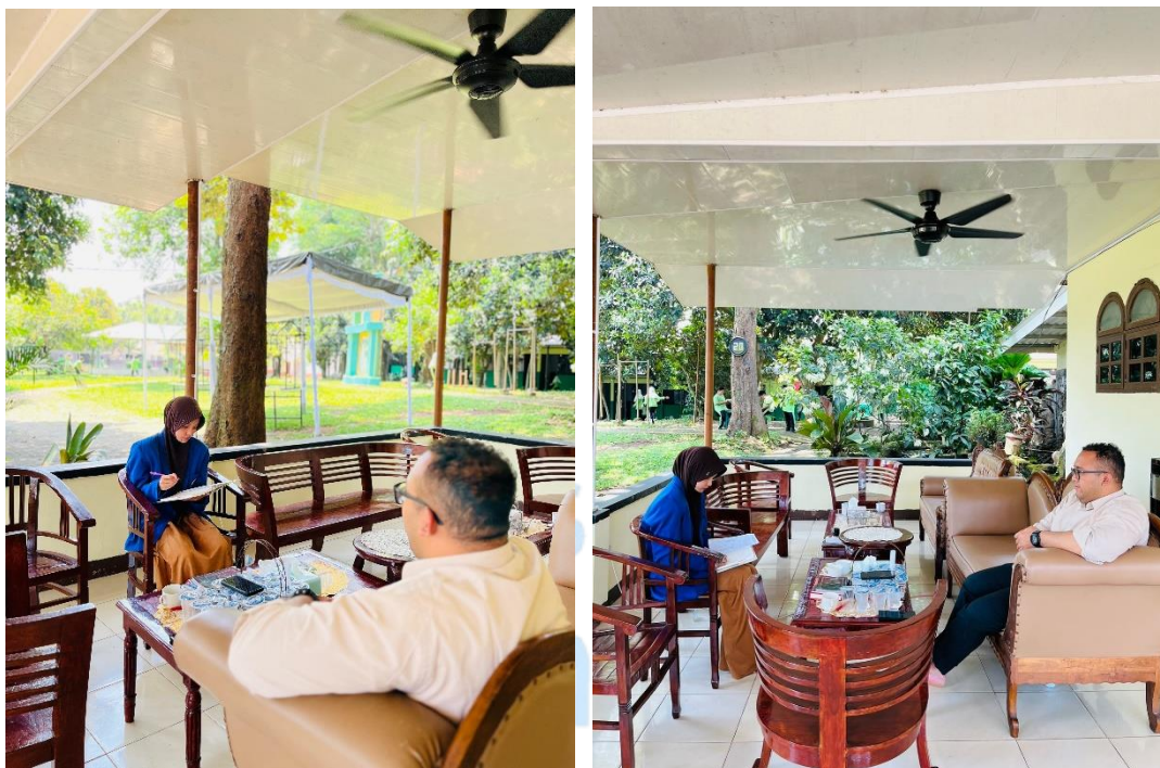
Gambar 1.1 wawancara bersama wakil pengasuh pondok pesantren