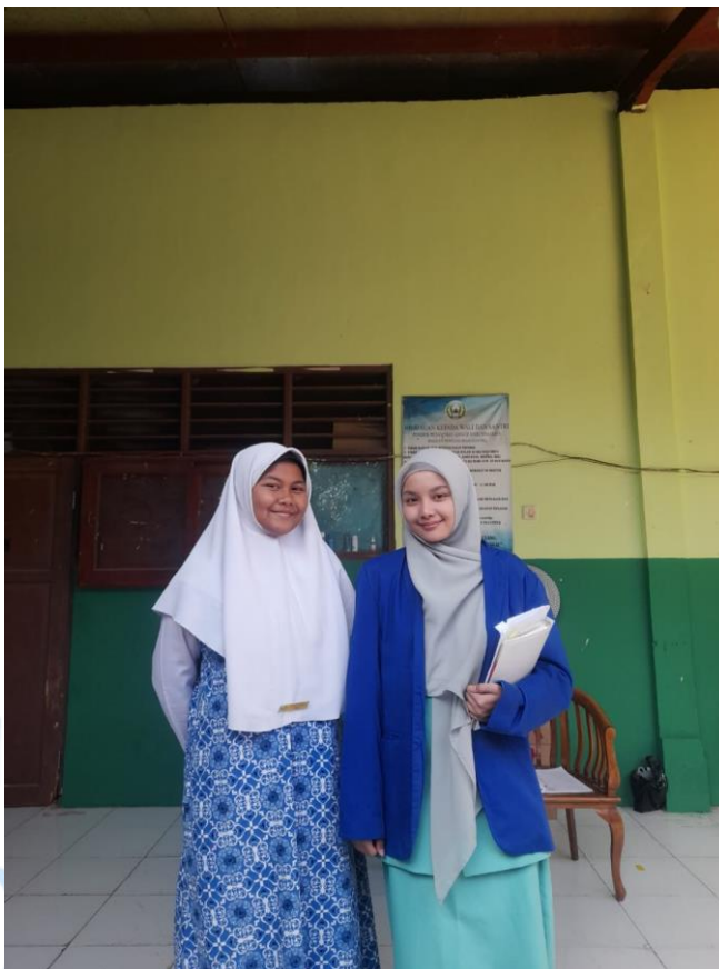
Gambar 1.4 wawancara bersama Santriwati kelas 5