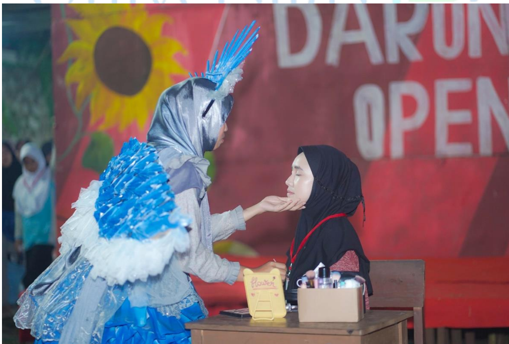
Gambar 1.9 Pelombaan Miss Nisaiyah pada Darunnajah Open ke-12