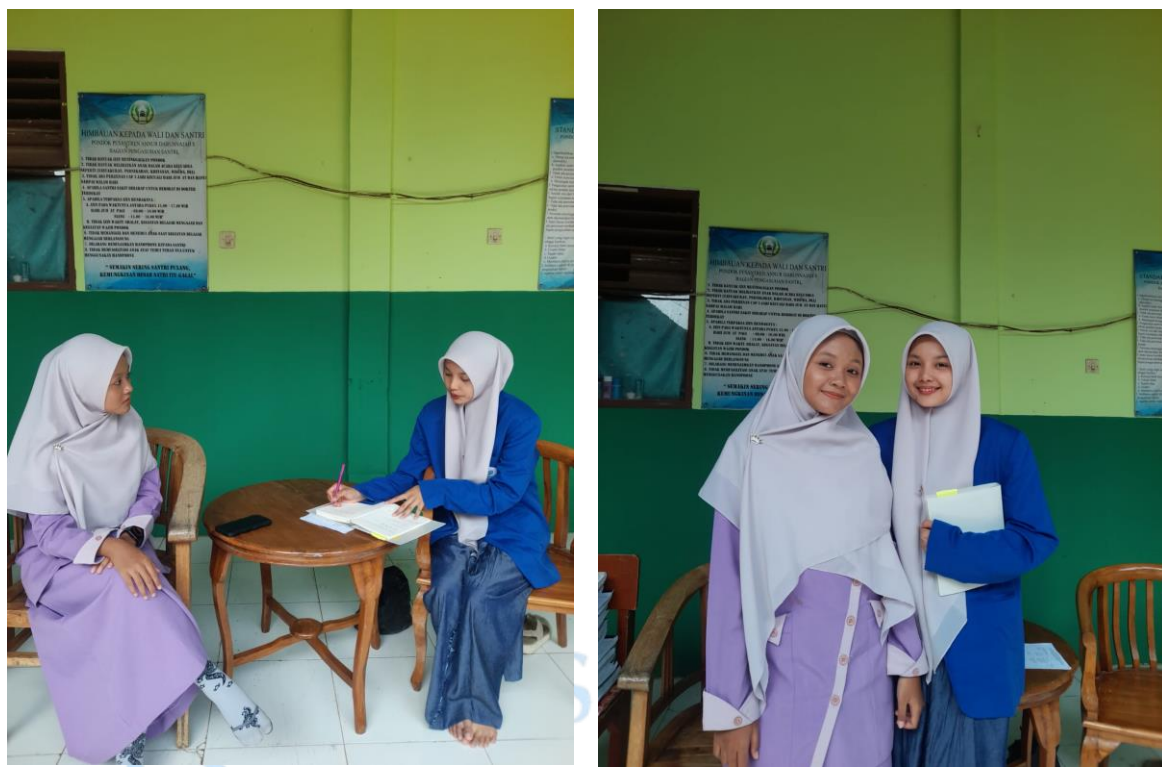
Gambar 1.3 wawancara bersama pembimbing nisaiyah OSANDN