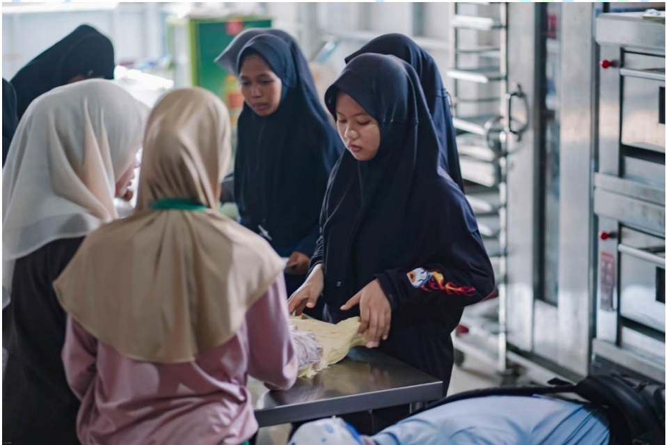
Gambar 1.10 Pelatihan pembuatan roti pizza