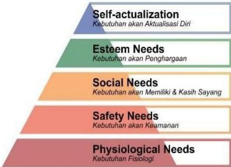
Gambar 2.1 Teori Hirarki Kebutuhan Maslow

menyeluruh, meningkatkan kemampuan diri, dan menjadi orang yang lebih baik. Kebutuhan aktualisasi diri oleh organisasi dapat dipenuhi dengan memberikan kesempatan orang-orang untuk tumbuh, mengembangkan kreativitas, dan mendapatkan pelatihan untuk mendapatkan tugas yang menantang serta melakukan pencapaian. 104