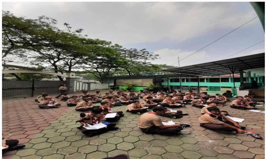
Foto kegiatan ekstrakurikuler Pramuka MTsN 13 Jakarta