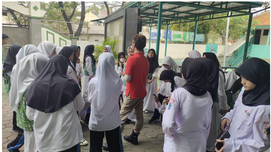
Foto kegiatan ekstrakurikuler PMR MTsN 13 Jakarta