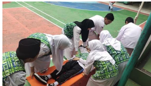
Gambar 4.9 Kegiatan Latihan Ekstrakurikuler PMR