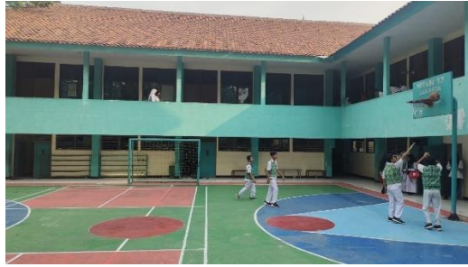
Gambar 4.10 Lapangan

yang sudah disediakan sehingga tetap terjaga. 23