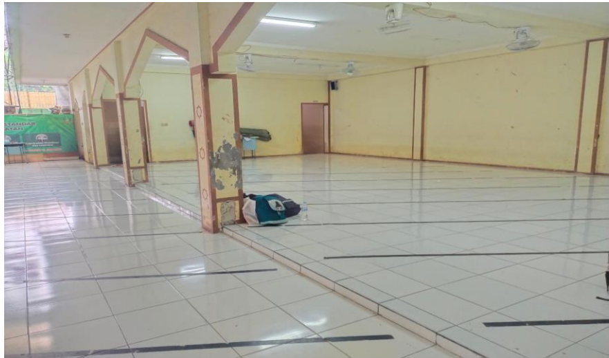
Foto Aula Serbaguna