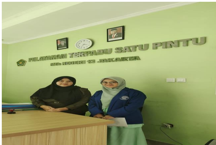
Foto Bersama Bagian Pelayanan Terpadu