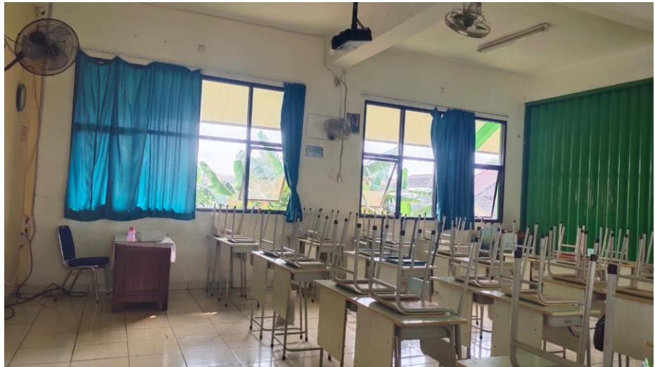
Foto Ruang Kelas