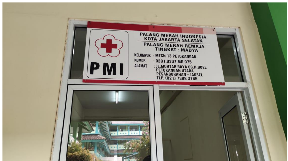
Foto Ruang PMR MTsN 13 Jakarta