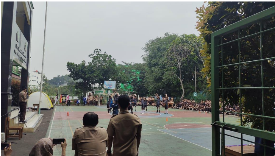
Foto Lapangan Gedung B