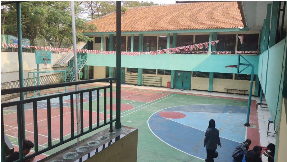
Foto Lapangan Gedung A