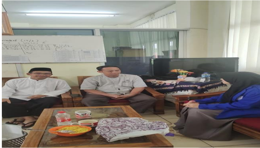
Foto Wawancara dengan Pembina Ekstrakurikuler