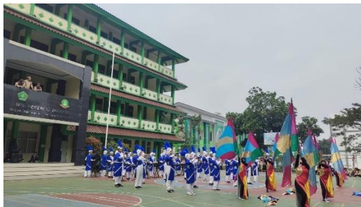
Gambar 4.5 Kegiatan Ekstrakurikuler

beberapa kegiatan ekstrakurikuler yang dilaksanakan di MTsN 13 Jakarta antara lain, PMR, PASKIBRA, PRAMUKA, Basket, Voli, Marching Band, Saman, Hadroh, Marawis, Karate, Robotic. 12