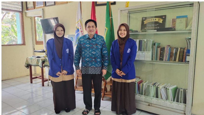
Foto wawancara dengan Kepala Madrasah MTsN 13 Jakarta