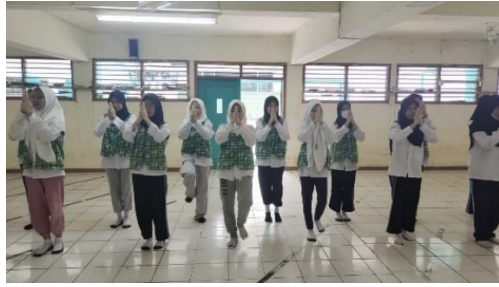
Gambar 4.8 Kegiatan Latihan Ekstrakurikuler Saman