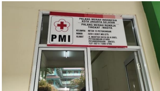
Gambar 4.11 UKS