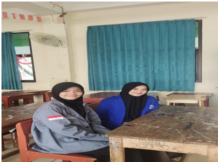
Foto wawancara dengan Ketua OSIS