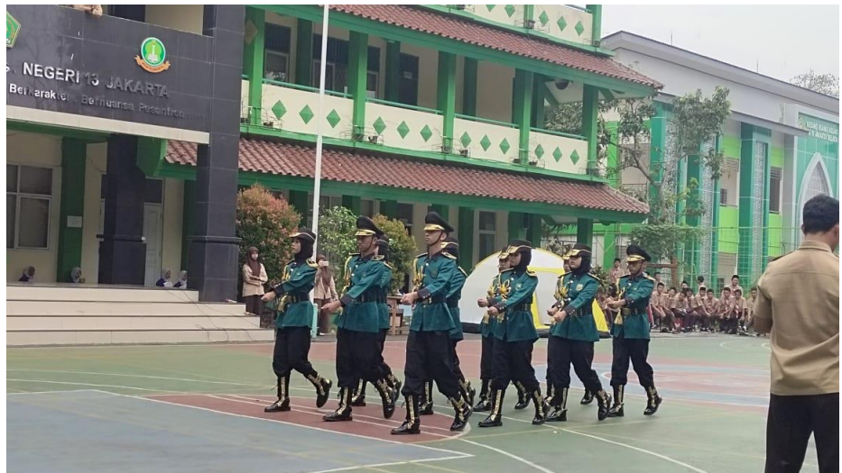
Foto Kegiatan PASKIBRA MTsN 13 Jakarta