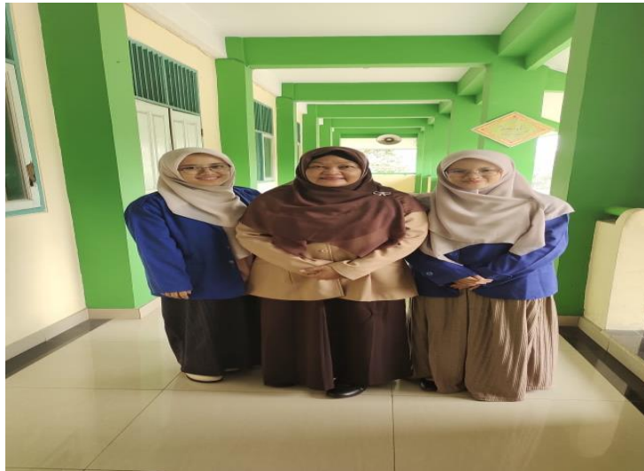
Foto Bersama Guru MTsN 13 Jakarta