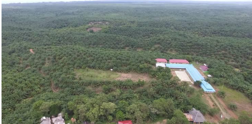
Keadaan Pondok Pesantren Putra dari Udara