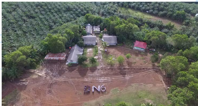
Keadaan Pondok Pesantren Putri dari Udara