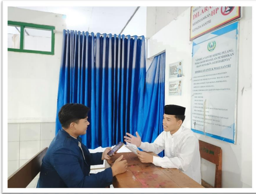
FOTO WAWANCARA DENGAN SANTRI DARUNNAJAH CIPINING