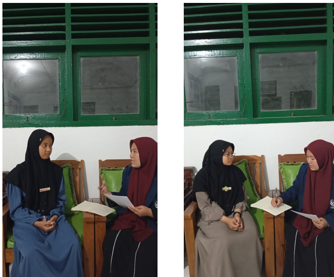
FOTO WAWANCARA SISWI KELAS VIII B Dan VIII E