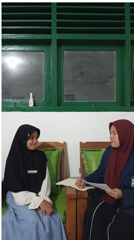
FOTO WAWANCARA SISWI KELAS VIII A