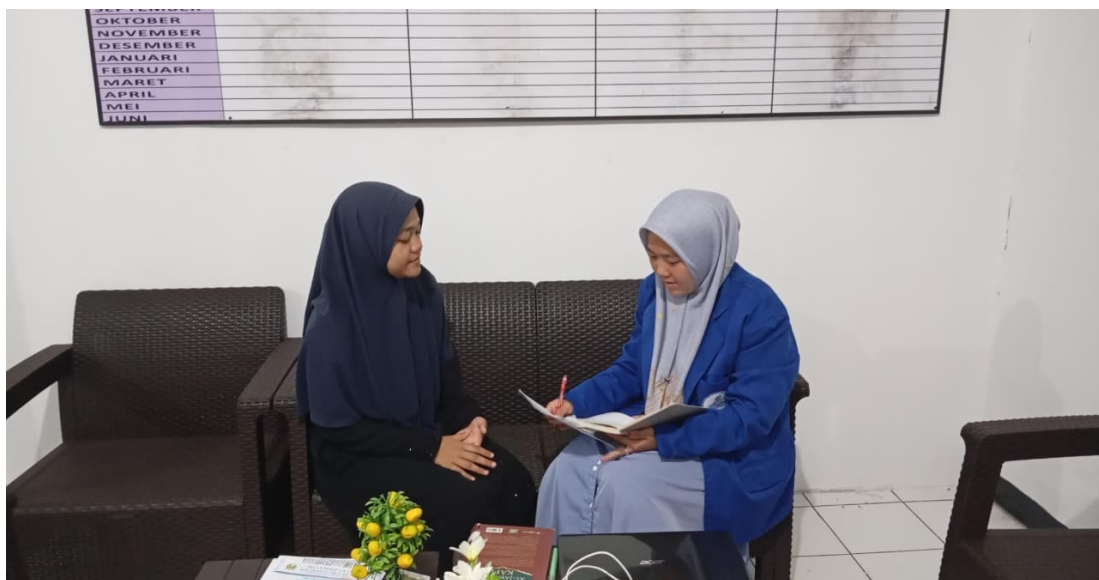
FOTO WAWANCARA WALI KELAS VIII G