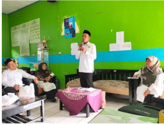
Gambar 4.9 Supervisi Kepala Sekolah