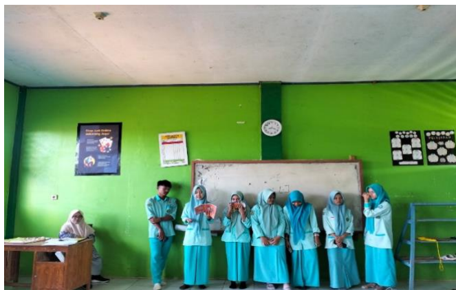
Gambar 4. 11 Persentasi Tugas Kelompok

relevan dengan materi pembelajaran. Hal ini memungkinkan siswa untuk menunjukkan kreativitas dan kemampuan problem-solving mereka.