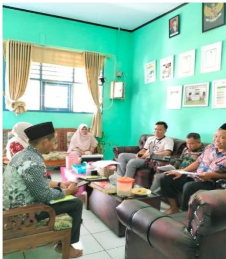
Gambar 4. 8 Asesmen sesama Pendidik