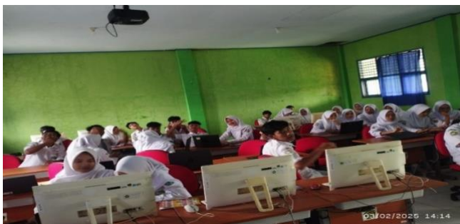
Gambar 4. 3 Lab Komputer

yang digunakan oleh anak-anak sebagai sumber belajar sehingga tidak ada lagi alasan untuk tidak belajar” 64