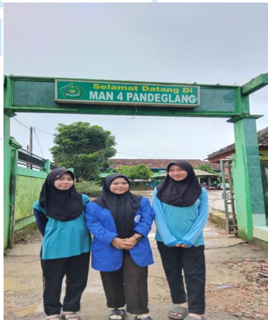
Wawancara dengan Siswi MAN 4 Pandeglang