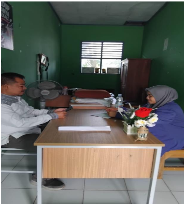
Wawancara dengan Bagian Kurikulum MAN 4 Pandeglang