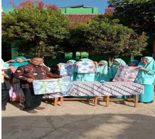
Gambar 4.4 Gelar Karya P5