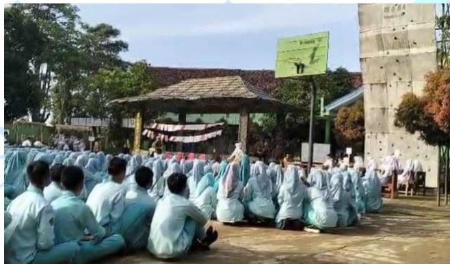
Gambar 4. 7 Gerakan Literasi Madrasah (GLM)

Dalam kegiatan ini, siswa dan guru bekerja sama dalam menumbuhkan budaya literasi dengan membaca, dan menulis. Tidak hanya itu di hari jum'at siswa juga melakukan zikir bersama. Kegiatan-kegiatan ini bukan sekedar rutinitas, tetapi menjadi wadah bagi siswa untuk berinteraksi dengan guru dalam suasana yang lebih terbuka dan kolaboratif.