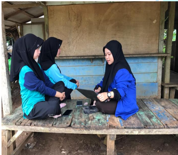
Wawancara dengan Siswi MAN 4 Pandeglang