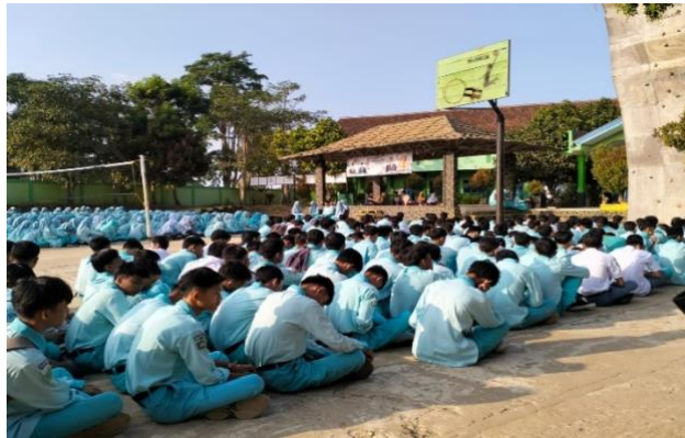
Gambar 4. 6 Asmaul Husna Bersama

juga memiliki kegiatan Gerakan Literasi Madrasah (GLM) yang di laksanakan setiap hari rabu.