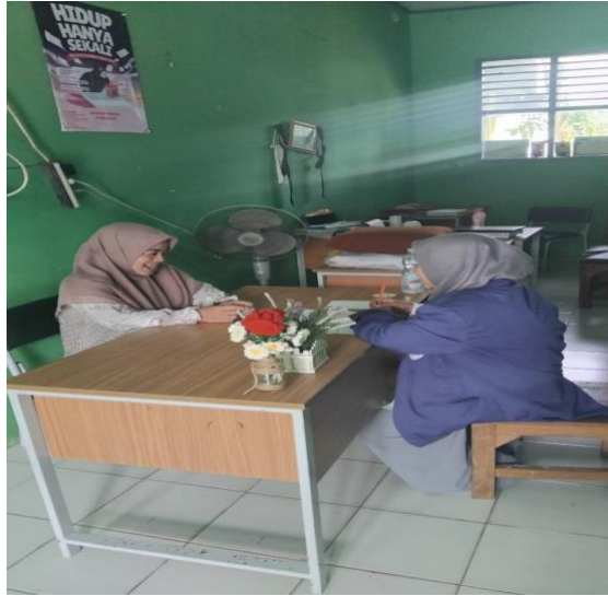
Wawancara dengan Guru MAN 4 Pandeglang