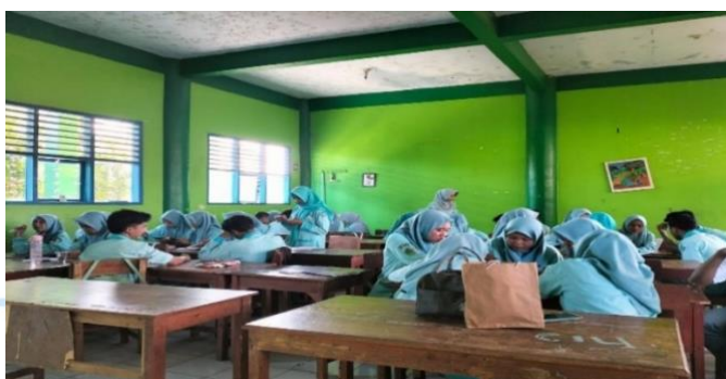
Gambar 4. 5 Siswa Melakukan Diskusi

“Dalam berdiskusi pada pembelajaran biasanya di lakukan dan itu yang terpenting dapat mengasah public speaking kita karena kita sudah terbiasa berbicara di depan banyak orang’. 69