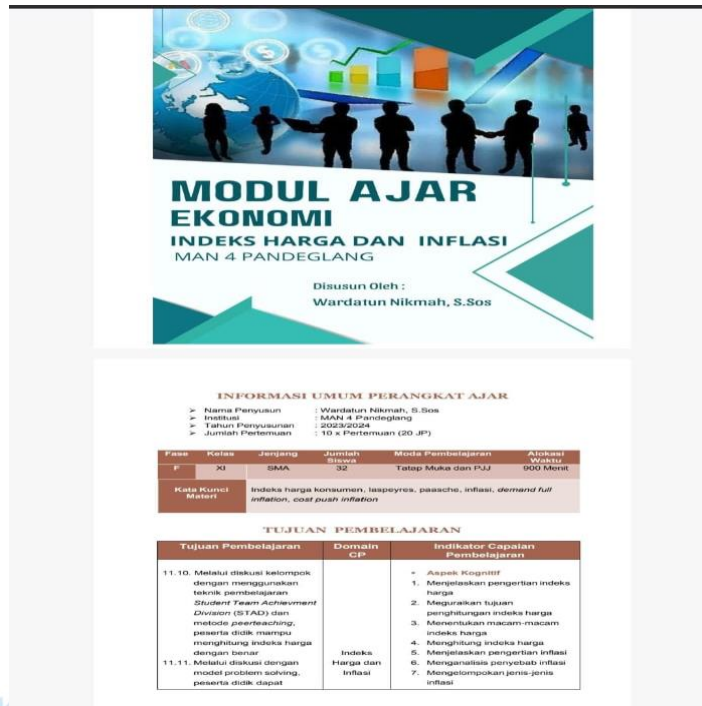
Gambar 4. 2 Modul Ajar