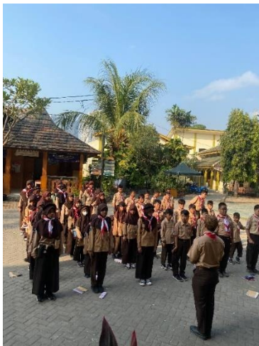
Pembelajaran Pramuka di SD Islam Al-Mubarak