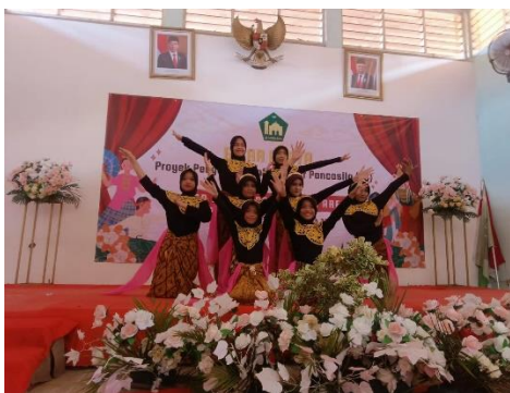
Gambar 4.3 Kegiatan program Projek Penguatan Profil Pelajar Pancasila (P5) di SD Islam Al-Mubarak.

“Iya program P5 ini memang salah satu kegiatan untuk meningkatkan kecerdasan emosional semua peserta didik. Karena pada pratikumnya, seluruh peserta didik akan terlatih mental dan adrenalin mereka untuk lebih percaya diri, berani, disiplin, mampu bekerja sama dengan tim, serta mampu mengelola emosional mereka.” 69