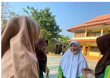
Wawancara dengan Siswa Kelas VI SD Islam Al-Mubarak