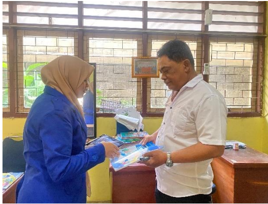
Wawancara dengan Waka Keagamaan SD Islam Al-Mubarak