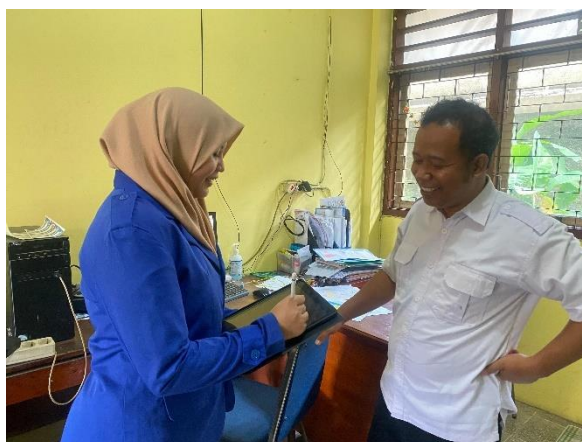
Wawancara dengan Waka Kurikulum SD Islam Al-Mubarak