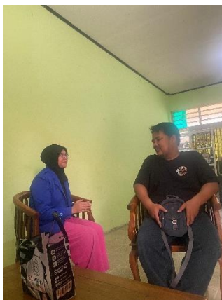
Wawancara dengan Kepala Sekolah SD Islam Al-Mubarak