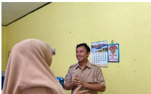
Wawancara dengan Waka Kesiswaan SD Islam Al-Mubarak