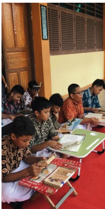
Kegiatan Belajar Mengajar di Luar Kelas SD Islam Al-Mubarak